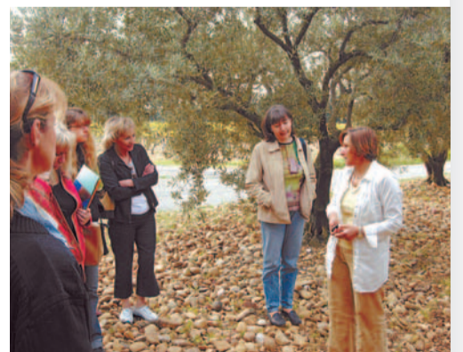
Explications dans le verger au Domaine de Pierredon à Estézargues.